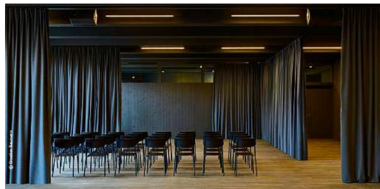
Akustikvorhänge für eine flexible Raumgestaltung.

■ inarum ag Neudorfstrasse 45 7430 Thusis