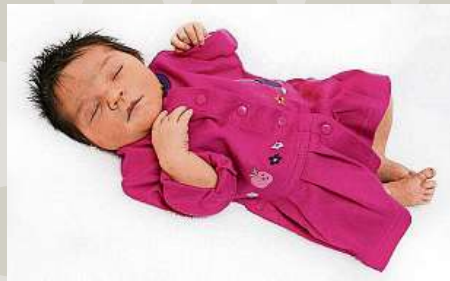
Nora Flims Dorf 16.02.2025